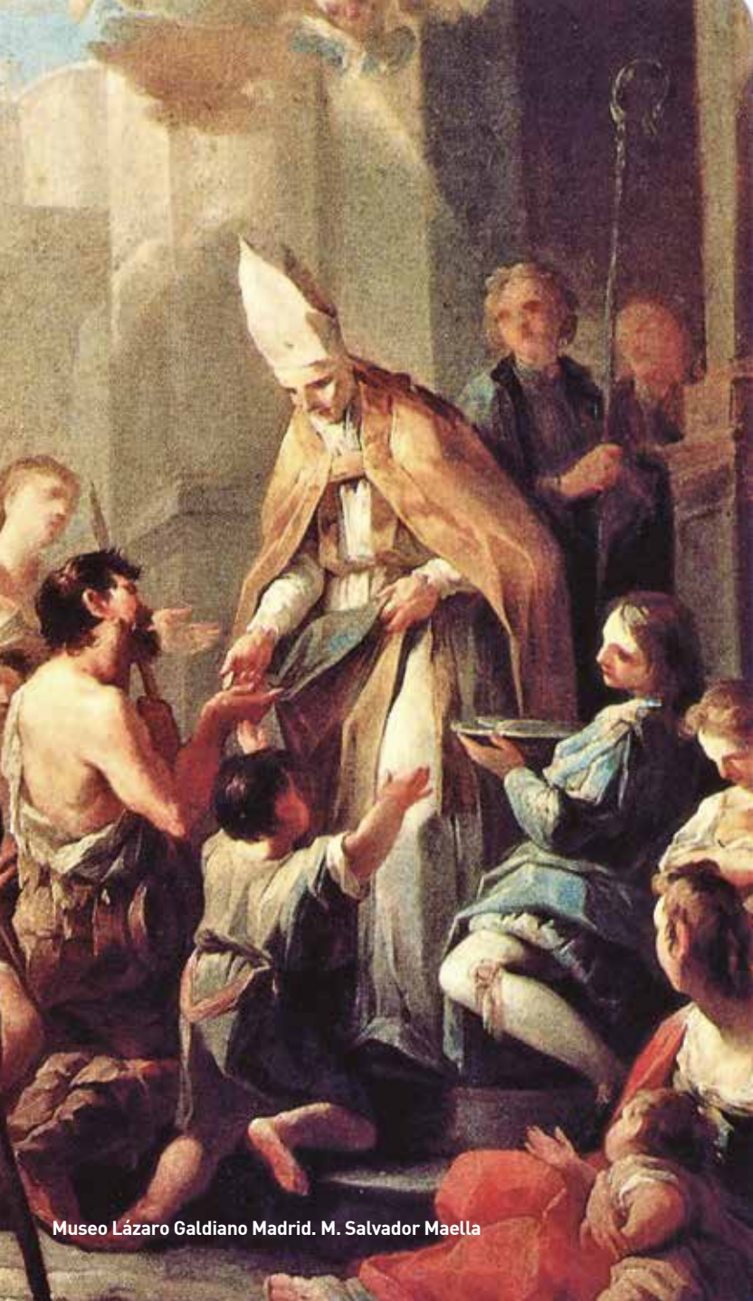
Museo Lázaro Galdiano Madrid. M. Salvador Maella